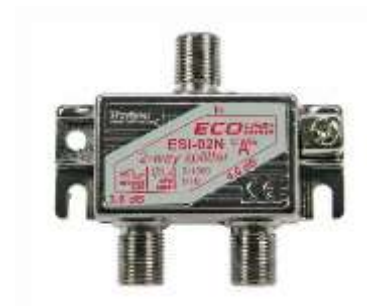
Abbildung 1 : ESI-02N-G