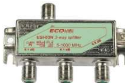
Abbildung 1 : ESI-03N-G