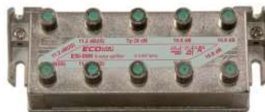
Figure 1 : ESI-08N