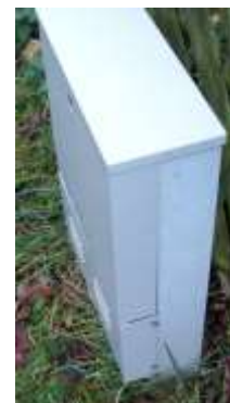
Abbildung 3 : LBx0 mit VTG50