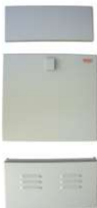
Abbildung 1 : VTG50

Anwendung : Einsatz im Aussenbereich zur Erweiterung der Tiefe von Konsolen des Typs LB50 der Firma Flori.