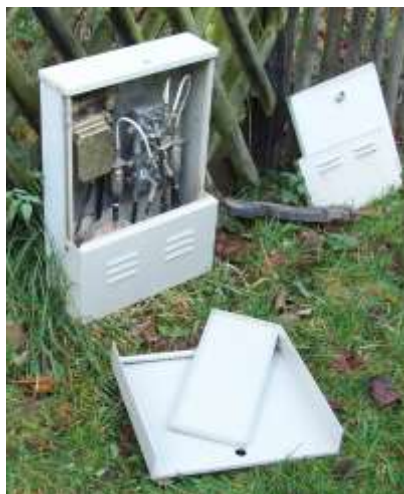
Abbildung 2 : LBx0 mit Vorderwand der VTG50