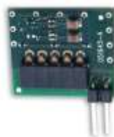
Abbildung 1: WRK31A

Gegenstand : Rückwegkorrektur WRK31A Bezeichnung : WRK31A Material-Nr. : 19420 Abmessungen : 21 x 25 x 5 [mm] (B x H x T) Beschrieb : Steckbares Modul Anwendung : Zur Frequenzgangkorrektur im Rückweg der Wisi Compact-Line Verstärker VX9x36.