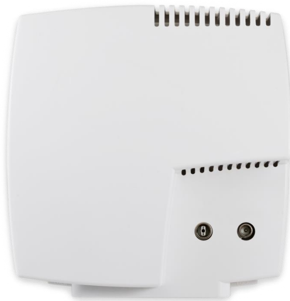
Abbildung 1: ONHA11

Gegenstand: FTTH Micronode Abdeckung ONHA11 Bezeichnung: ONHA11 Material-Nr. : 20505 Abmessungen: 200 x 208 x 66 [mm] (B x H x T) Beschrieb: Micronode Abdeckung für RFoG-ONU mit vorverdrahteter 11 dB Breitbanddose. Anwendung: In FTTH-Netzten.