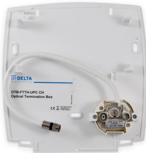
Abbildung 2: ONHA11 Montageplatte

Die ONU Abdeckung besteht aus einer Abdeckschale (Abbildung 1) und einer Montageplatte (Abbildung 2) für die Befestigung an die Wand.