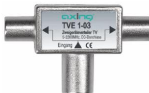
Abbildung 1: TVE 1-03

Gegenstand: Aufsteckverteiler TV TVE 1-03 Bezeichnung: TVE 1-03 Material-Nr. : 21405 Abmessungen: 55 x 34 x 18 [mm] (B x H x T) Beschrieb: Massives Zink-/Druckgussgehäuse mit 1x IECf-Buchse / 2x IECm-Stecker. Bandbreite 0.1...2200 MHz und DC-Durchlass. Anwendung: Zum Anschliessen von zwei TV-Geräten an eine Breitbanddose.